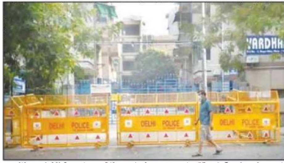
sensitive establishments, is home to embassies and high commissions of several countries across the world and since top functionaries

Challenging this decision, ASC Narayan, on Wednesday, told the court that to curb law and order problems, address security concerns, especially keeping in mind that Delhi is the national capital and the seat of the central government, houses