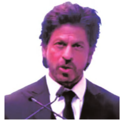
शाह रुख खान से उर्फी जावेद...पृष्ठ-8